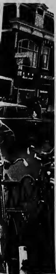
simbolico di "Zorba the instrumentmaker. Casualmente e dianan aki.